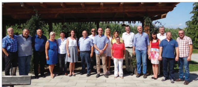
D. O., foto: F. O.

V Cerkvenjaku so pogovori potekali 20. julija, drugi dan obiska, na Domačiji Firbas.