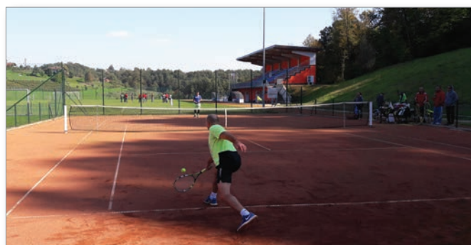
Tekma za 1. mesto