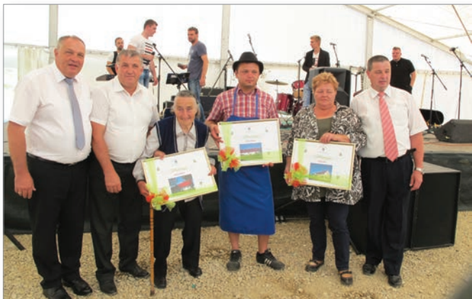
Turistično društvo Cerkevjak je podelilo priznanja za najbolj urejeno okolje.