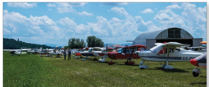
Obisk številnih letal iz vse Slovenije na Letalskem dnevu 2017

Kot vedno je tudi leto 2017 v Aero klubu Sršen Cerkevjenjak zastavljeno ambiciozno ter uspešno in kot tako se kaže tudi v realnosti.