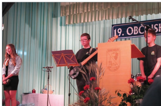
V bogatem kulturnem programu so sodelovali tudi mladi iz Osnovne šole Cerkvenjak.