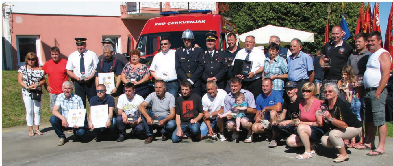
Priznanja in zahvale so dobili tudi botri novega vozila.