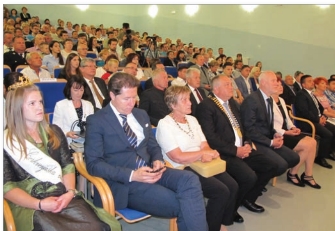
Dvorana Kulturnega doma v Cerkvenjaku je bila na osrednji proslavi ob prazniku občine Cerkvenjak, na kateri je bil tudi predsednik Državnega zbora Republike Slovenije Milan Brglez, polna do zadnjega kotička.