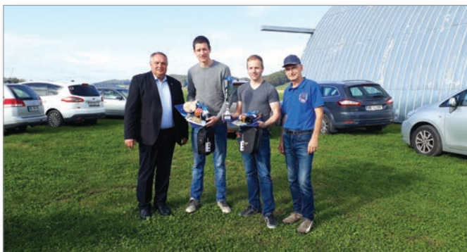
Čestitke državnima prvakoma s strani župana in predsednika kluba

V začetku oktobra smo v klubu skupaj z županom Občine Cerkvenjak izvedli tudi sprejem za državna viceprvaka in se jima na ustrezen način zahvalili ter čestitali za velik uspeh.