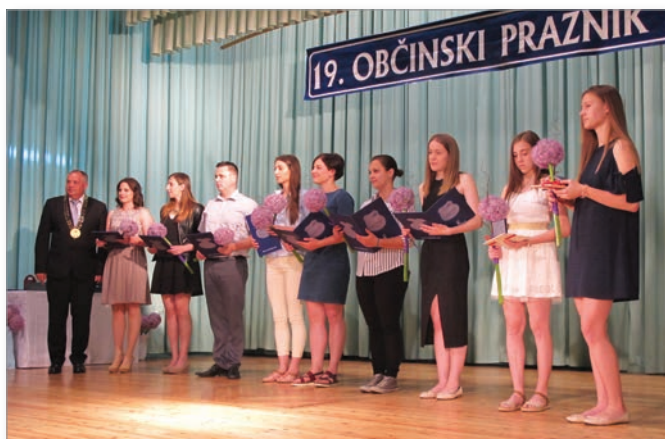
Diplomanti in najboljši dijaki in učenci, ki so prejeli priznanje in nagrado občine Cerkvenjak.