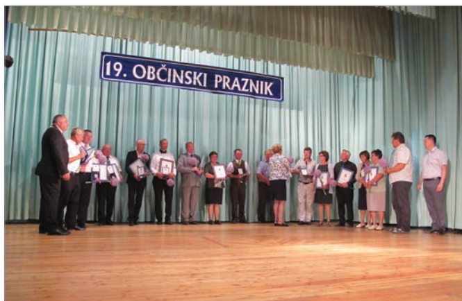
Prejemniki občinskih priznanj.