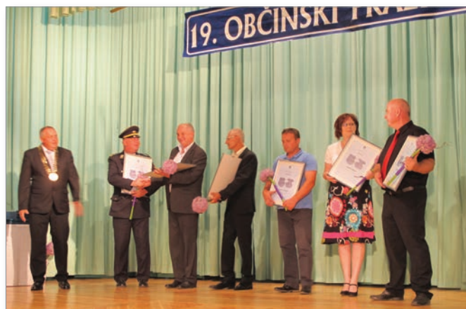
Prejemniki županovih priznanj.