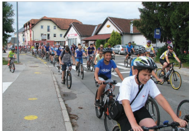
Veselo cilju naproti

lesark s progo opravilo brez kakršnih koli težav, so pa zato toliko bolj komplicirali uradniki pri prijavi prireditve. Poleg kolesarjev je pri izvedbi prireditve sodelovalo še tehnično osebje, tako da je bilo v dogajanje vključeno skupaj s kolesarji blizu 200 ljudi.