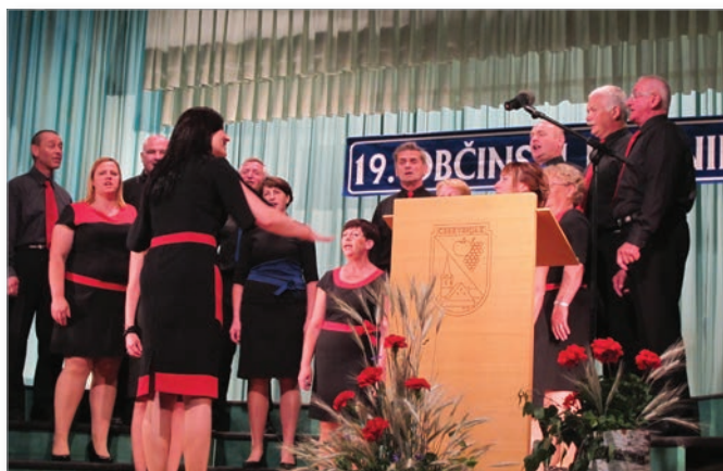
Utrinek iz bogatega kulturnega programa na osrednji proslavi ob 19. občinskem prazniku.