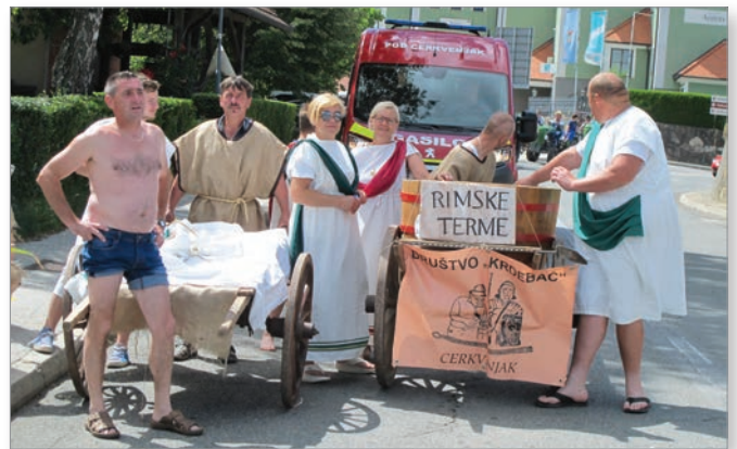
Cerkvenjaški "stari Rimljani" po nastopu v povorki