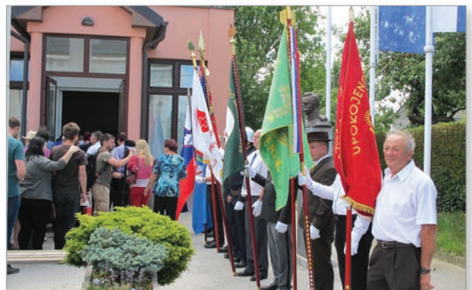
Praporščaki so poskrbeli, da je bil praznični dan v Cerkevniku zares slovesen.