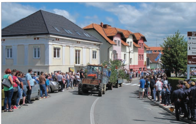
Tudi letos si je povorko starih navad in običajev skozi Cerkevnik prišlo ogledat veliko obiskovalcev od blizu in daleč.