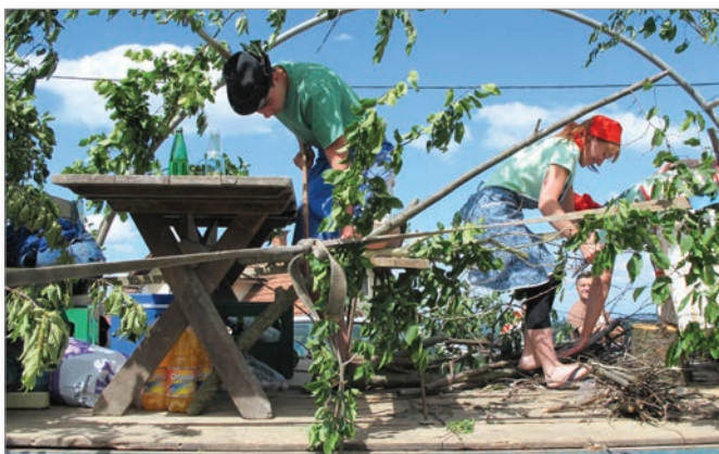
Skupine iz naselij so obudile stare običaje.