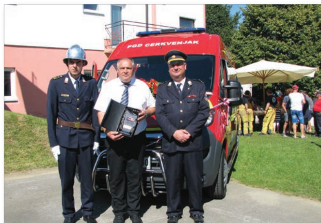
Občina Cerkvjenjak je prejela posebno društveno priznanje.