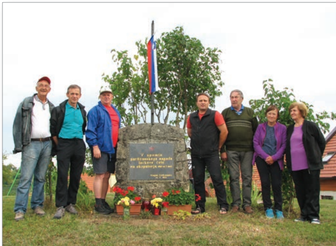
Udeleženci pohoda ob spominskem obeležju v Stanetincih

V Cerkvenjaku pa so se člani in simpatizerji za spoštovanje vrednot narodnoosvobodilnega boja 14. julija s pohodom spomnili na dogodek, ko je pred 75-imi leti v Stanetincih na ta dan na območju bivše velike občine Lenart počila prva partizanka puška.