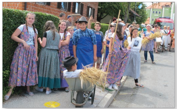
V povorki so stare običaje obudili tudi mladi.