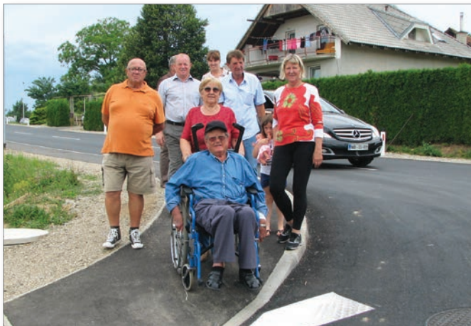
Omogočen je tudi vstop in sestop za invalide na vozičkih.

Vsi, ki dnevno vozimo po tej cesti, vemo, kako potrebna je bila te rekonstrukcije in pločnikov ob njej, saj so pešci morali večkrat stopiti v jarek, da so se lahko izognili prihajajočim vozilom. Pločnik in javna razsvetljava bosta tako omogočala bolj varno pot pešcem, še zlasti mnogim šolarjem, ki dnevno gredo v šolo in domov ob tej zelo prometni cesti. Seveda pa pot do tega ni bila lahka, saj smo se morali kar nekajkrat pogovarjati na Direkciji za infrastrukturo o dokončni ureditvi tega dela ceste in že danih obljubah iz preteklosti. Ta gordijski vozil smo končno presekali konec leta 2015 in v začetku leta 2016, ko