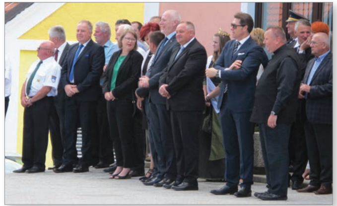
Povorko so si z zanimanjem ogledali tudi gosti.