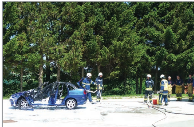
Vaja v gašenju gorečega vozila