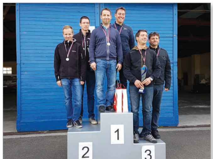
Člana AK Sršen sta na DP ULN 2017 dosegla 2. mesto.