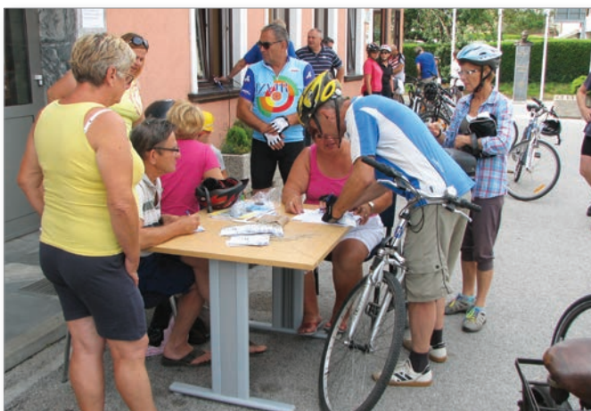
Ob prijavi za kolesarjenje se treba tudi podpisati, saj vsak udeležene sodeluje na lastno odgovornost.

S kolesom po mejah občine je rekreativno kolesarjenje s štiri kontrolnimi točkami, na katerih se kolesarji lahko tudi odčepajo. Kot je povedal Borko, je vseh 160 kolesarjev in ko-