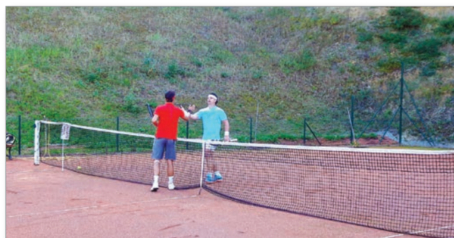
Tekma za 3. mesto