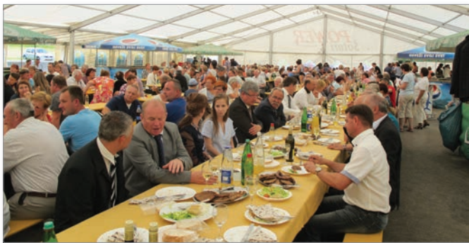
Tako kot vsako leto je bilo tudi letos na družabnem srečanju v šotoru prijetno in veselo.