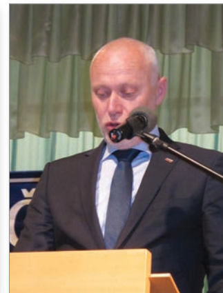
Slavnostni govornik, predsednik Državnega zbora Republike Slovenije Milan Brglez, je domačinom čestital za složnost pri razvijanju občine in ohranjanju "duše" domačih krajev.