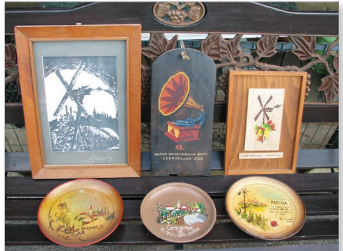
Takšnih spominkov so bili na prvih 16-ih festivalih v Cerkvjenjaku deležni vsi ansamblji, pa tudi člani komisij in napovedovalci.