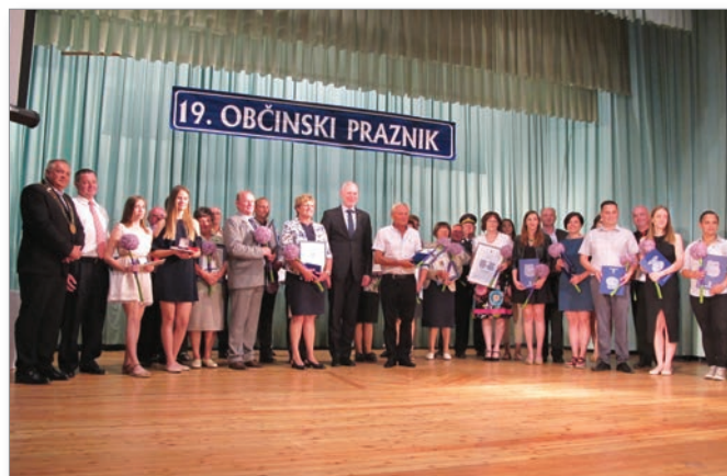
Vsi prejemniki priznanj so se fotografirali tudi s predsednikom Državnega zbora Republike Slovenije Milanom Brglezom. Ob njem sta dobitnika zlatega grba občine.